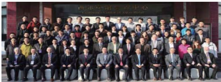
ISSNP2013の参加者集合写真

今回のISSNP2013 は、ポスト福島第一原発事故時代の“和諧”型原子力発電システムを基調として、それに関わる（1）原子力システムの運転とシミュレーション技術、（2）原子力安全技術、（3）マンマシンインタフェース技術および（4）人間、機械、環境の共生を発展させる技術に関する展望と研究発表が行われました。参加者数約八十名、参加国八か国（中国、日本、韓国、フランス、米国、スイス、デンマークおよびドイツ）、技術論文数 七十二件、口頭発表件数 四十二件。なお、“和諧”とは中国の胡錦濤・前政権が新たに掲げたキーワードで、奇しくも“共生”とニュアンスが一致しています。目下の我が国の原子力を取り巻く社会情勢だけでなく日中韓関係についても和諧が望まれるところです。